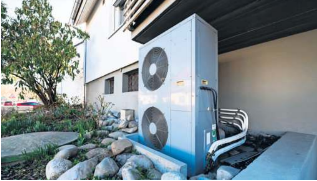
Erdwärmepumpen wie diese sollen künftig die Wärme für Wohnhäuser liefern – so hätte es zumindest die Ampelkoalition gerne.

eine sinnvolle Lösung darstellen, entscheidend sind jedoch immer auch die Gegebenheiten vor Ort“, so Arenz. Zunächst sollte jeder sich klarmachen, dass es in der Gesetzesnovelle zum GEG lediglich um neu einzubauende Heizungen geht. Bestehende Öl- und Gas-Heizungen dürfen innerhalb einer Übergangsfrist weiter genutzt und repariert werden. Sofern die alte Heizungsanlage nicht wieder instand gesetzt werden kann, muss jedoch eine Heizung mit 65 Prozent erneuerbaren Energien eingebaut werden. „Bei älteren Anlagen kann es daher empfehlenswert