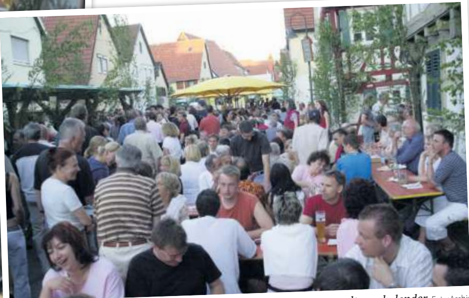
Was sich nicht geändert hat: Das Fest ist ein Höhepunkt im Veranstaltungskalender.