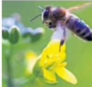
Gärtnern besser ohne Gift: Insekten lieben pestizidfreie Gärten.

• Nur heimische Pflanzen: Exotische und stark gezüchtete Pflanzen bieten unseren Tieren kaum Nahrung. Eine Hecke aus verschiedenen heimischen Sträuchern gibt mehr Tierarten Nahrung und Lebensraum als eine Monokultur.