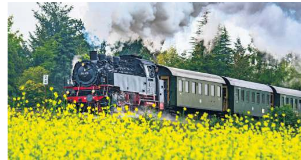
Der „Feurige Elias“ ist zum vorletzten Mal mit der alten Lok unterwegs. Im September wird sie abgelöst.

■ STROHGÄU Am Sonntag, 18. Juni, dampft und pfeift es wieder auf der Strohgäubahn: Der Museumszug „Feuriger Elias“ ist zwischen Korntal und Weissach unterwegs. Mit einer maximalen Geschwindigkeit von 40 Stundenkilometer befährt der historische Dampfzug die rund 22 Kilometer lange Strecke, die Fahrt dauert rund eine Stunde pro Richtung. Abfahrt ist in Weissach um 9.43, 13.43 und 16.43 Uhr, in Korntal fahren die Züge um 11.16, 15.16 und 18.16 Uhr ab. Zum Einsatz am „Feurigen Elias“ kommt zum vorletzten Mal die 86 Jahre alte Dampflokomotive 64 419, bevor die Lok im September aus Betrieb gehen wird. Die angehängten historischen Waggons mit ihren offenen Plattformen und den mit