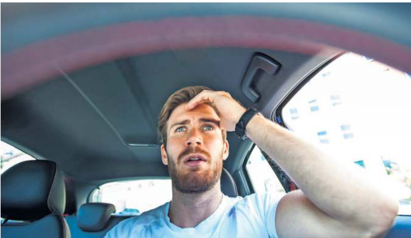
Ein Mann erschreckt sich beim Autofahren. Vielleicht durch den Aufschrei des Beifahrers, oder weil ein Assistenzsystem plötzlich lospiept. In solchen Situationen heißt es: Ruhe bewahren.

Es gibt Studien, die zeigen, dass die verbale Ablen-