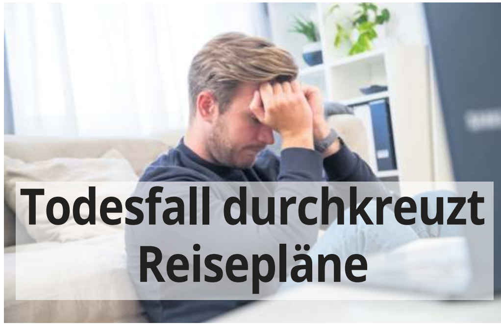
Die Schocknachricht vom Tod eines geliebten Menschen kommt direkt vor der Reise: Wer kann dann noch an Urlaub denken?

Stirbt ein geliebter Mensch, ist an Urlaub nicht mehr zu denken. Kurzfristige Stornierungen oder Reiseabbrüche können jedoch enorm viel Geld kosten - und auf Kulanz sollte man dann nicht hoffen.