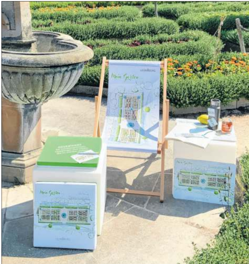
Die neuen Souvenirs haben den Pomeranzengarten als Motiv.

Pünktlich zum Start in den Sommer 2023 wurde das Citymanagement wieder kreativ. Mit der neuen „Mein Garten...“-Serie setzt die Stadt bei ihren Souvenirs voll auf das schöne Kleinod am Rand der Altstadt: den Pomeranzengarten. Die Souvenirs sind beim Altstadt-Jazz-Garten und ab Dienstag, 20. Juni, im i-Punkt im neuen Rathaus erhältlich.