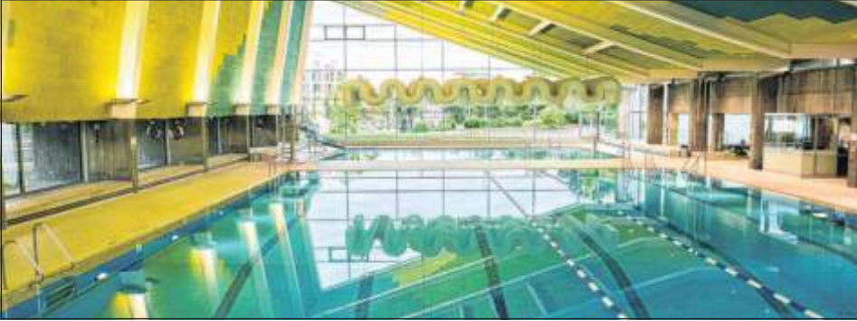
Für das Bistro im Hallenbad wird ein neuer Pächter gesucht.

Am Freitag, 30. Juni, 19 Uhr, tritt „Die TanzKompanie“ aus Esslingen in der Steinturnhalle auf. Der französische Choreograf Grégory Darcy bringt mit seinem inklusiven Tanzensemble auf hohem Niveau das Thema Behinderung und Tanz auf die Bühne. Dauer: etwa eine Stunde. Am Samstag, 1. Juli, erleben Besucherinnen