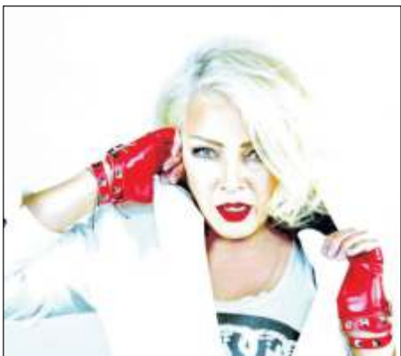
Die britische Sängerin Kim Wilde tritt am Samstag, 15. Juli, beim Leonpalooza auf dem Bürgerplatz auf.

Das Leonpalooza-Festival lädt von Donnerstag, 13. Juli, bis Sonntag, 23. Juli, zum vierten Mal auf dem Bürgerplatz vor der Stadthalle ein. Zahlreiche Künstlerinnen und Künstler aus Deutschland und der Welt gastieren in der Engelbergstadt und sorgen für Stimmung. Tickets für die Konzerte gibt es unter www.leonpalooza.de und in der Stadthalle.