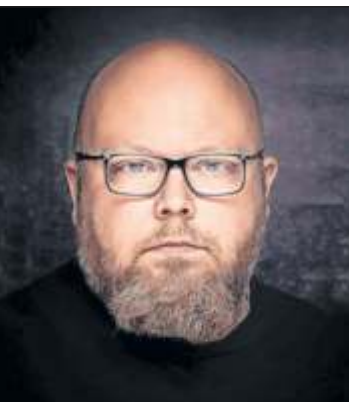
Die Supportshow am Samstag, 15. Juli, spielt Andreas Kümmert.

Auch in diesem Jahr verwandelt sich der Bürgerplatz an zehn Abenden im Juli in ein Festivalgelände. Das Programm ist vollgepackt mit einer bunten Mischung aus Musik, Show, Variété und Lesung. Die Musikgenres reichen dabei von Jazz über Pop bis hin zu Rock 'n Roll. Ein besonderer Abend erwartet die Gäste am Samstag, 15. Juli. Dann tritt nicht nur Kim Wilde, eine der berühmtesten Rockröhren überhaupt, auf – sie bekommt auch noch Unterstützung von niemand geringerem als Andreas Kümmert. Während Kim Wilde als freche Pop-Ikone der 1980er-Jahre gilt und mit Pop- und Rockmusik begeistert, bringt Andreas Kümmert mit seinem einzigartigen Blues ein weiteres Genre mit. Der Abend verspricht ein vielfältiges Programm, gewaltige Stimmen, laute Gitarren und dennoch viel Gefühl.