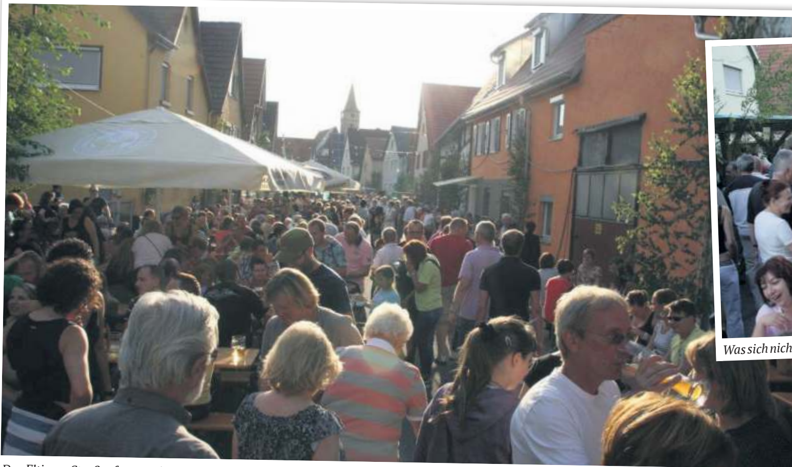
Das Eltinger Straßenfest wurde von „Lyra-Leo-Beach“ abgelöst.