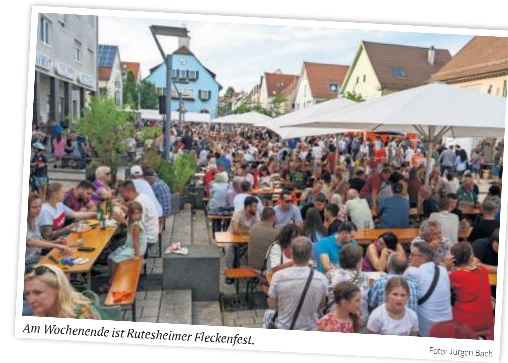
Am Wochenende ist Rutesheimer Fleckenfest.

der Musikverein zum Fröhlichen. Um 13.30 Uhr spielt das Modern Music Orchester der Jugendkapelle des Musikvereins Rutesheim. Tänzerische Unterhaltung gibt es um 14.30 Uhr mit der Cheerleader-Gruppe der SKV Rutesheim und um 16.30 Uhr mit dem Tanzkreis des Griechischen Elternvereins. Um 15.30 Uhr zeigt der Turnernachwuchs des SVP sein Können.