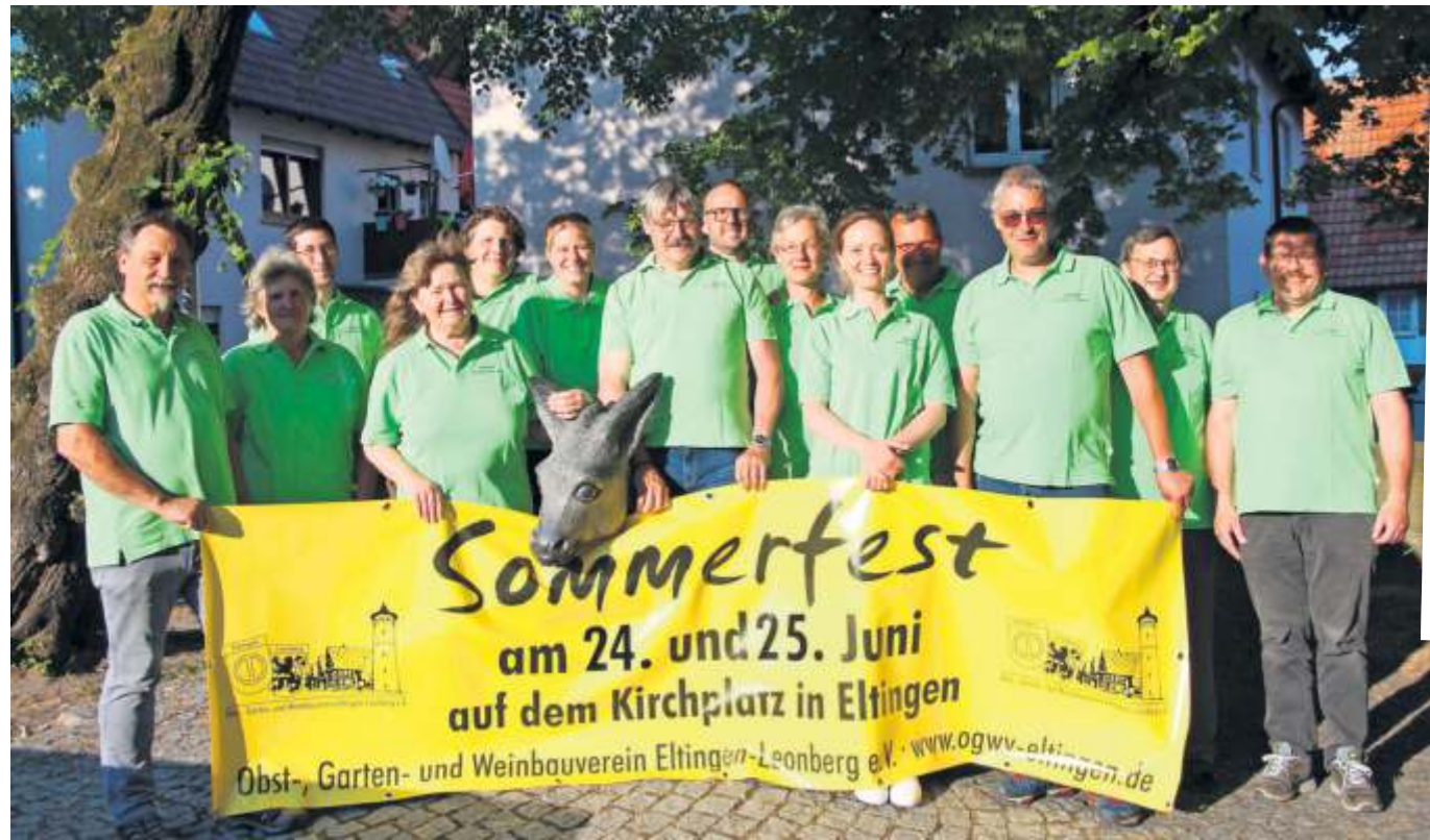
Am Wochenende findet das Sommerfest des OGWW statt.