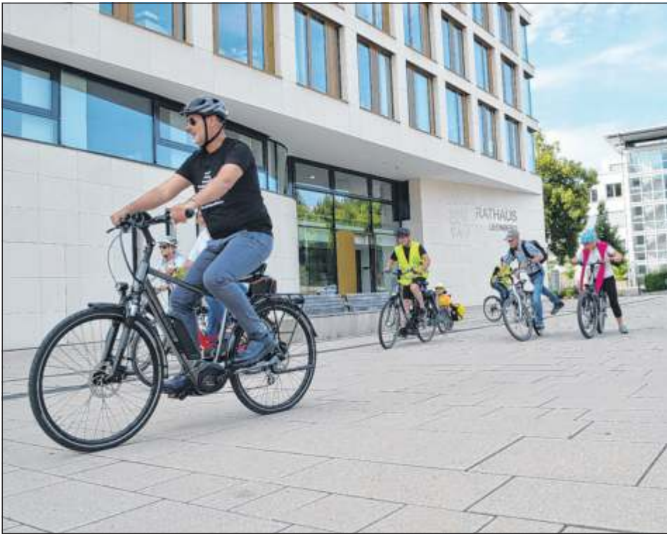
Vom 2. bis 22. Juli werden beim STADTRADELN wieder Kilometer für nachhaltige Mobilität gesammelt.

Leonberg tritt im Rahmen der Aktion STADTRADELN, gegründet von der Initiative RadKULTUR, zwischen 2. und 22. Juli in die Pedale. Nachhaltige Mobilität fördern und dabei Gemeinschaft erleben – das sind Motive für viele, die sich einem Leonberger Team anschließen. Beim Radaktionstag am Freitag, 23. Juni, können alle Interessierten ihr Fahrrad kostenfrei durchchecken lassen.