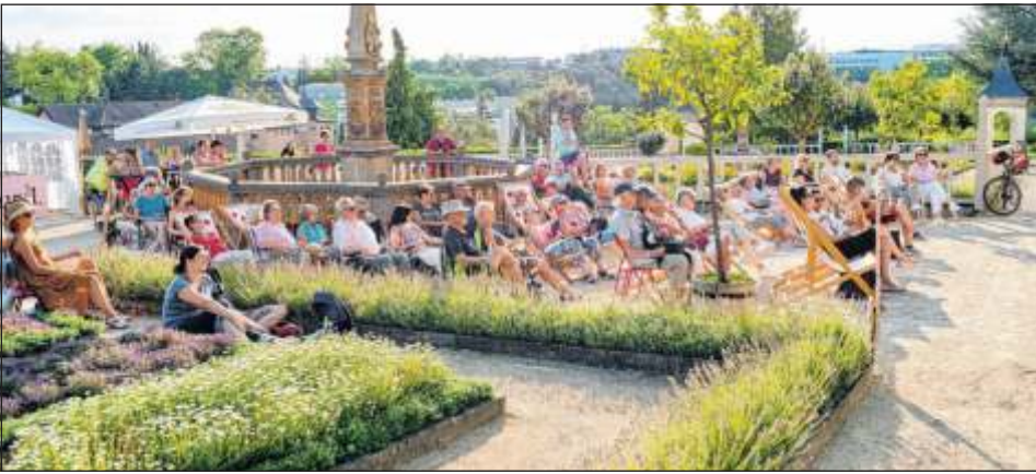
Im Pomeranzengarten werden im Sommer wieder Gute-Nacht-Geschichten vorgelesen.

Wer als Vorleserin oder Vorleser mitmachen möchte, sollte zudem Buchtitel, Autor (gegebenenfalls Übersetzer), ISBN, Verlag und Genre angeben. Für Rückfragen steht Gina Schmid ( g.schmid@leonberg.de , 07152 990-1401) aus dem Amt für Kultur und Sport zur Verfügung.