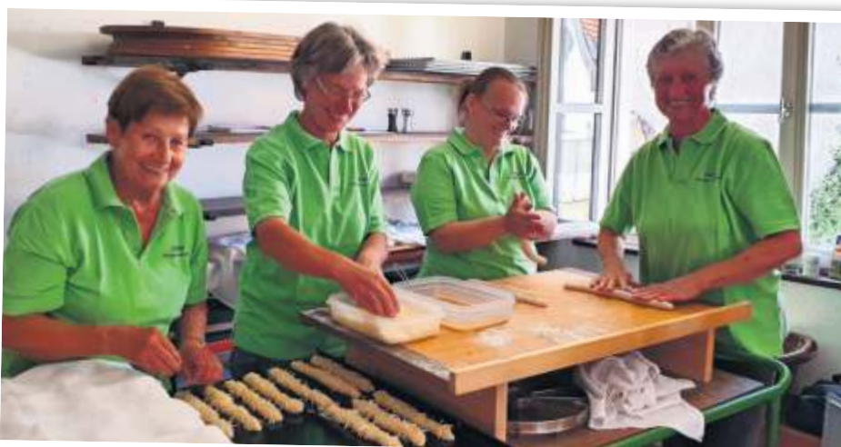
An beiden Festtagen werden frische Hefe-Stängele und Zwiebelkuchen gebacken.