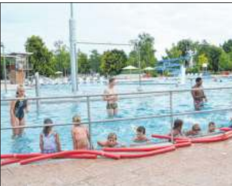
Bei den Ferienkursen sind unter anderem noch Plätze im Seepferdchen- und Aufbauschwimmkurs frei.

Mit Beginn der Sommerferien am Donnerstag, 27. Juli, startet auch das Sommerferienprogramm der Stadtverwaltung Leonberg. Die Nachfrage ist auch in diesem Jahr sehr groß. Wer sich noch nicht entscheiden konnte, hat noch immer eine vielfältige Auswahl an sportlichen Aktivitäten und kreativen Angeboten. Unter anderem sind bei untenstehenden Kursen noch Plätze frei. Die Anmeldung ist unter www.ferien.leonberg.de möglich. Dort sind auch weitere freie Kurse zu finden.