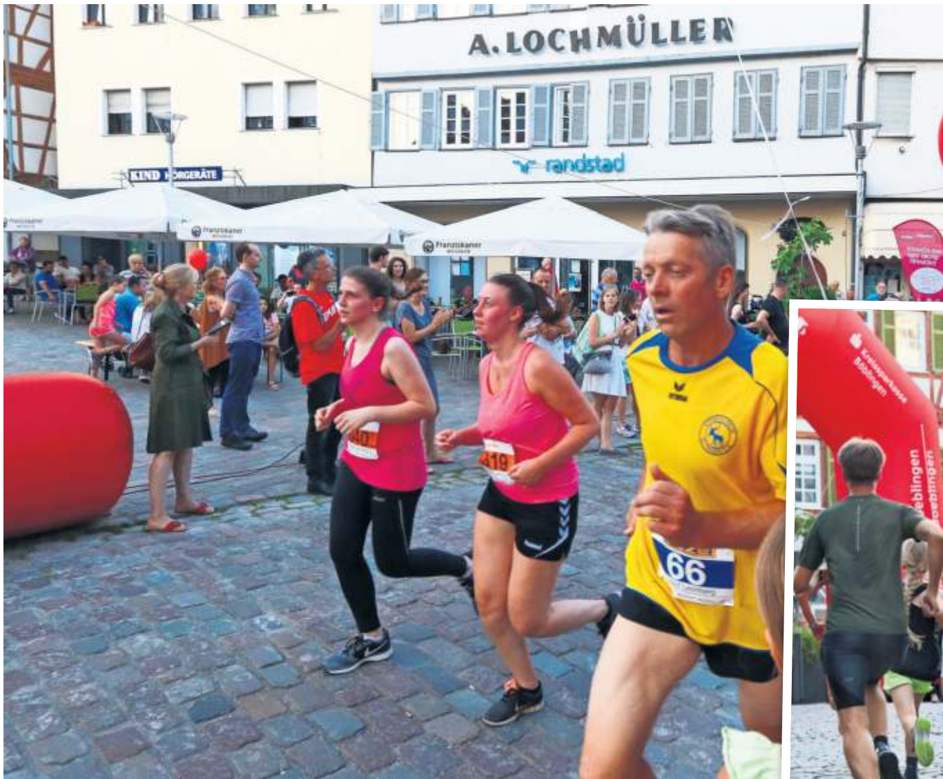
Die Strecke führt auch durch die Altstadt. Wie auf diesem Bild aus den Vorjahren.