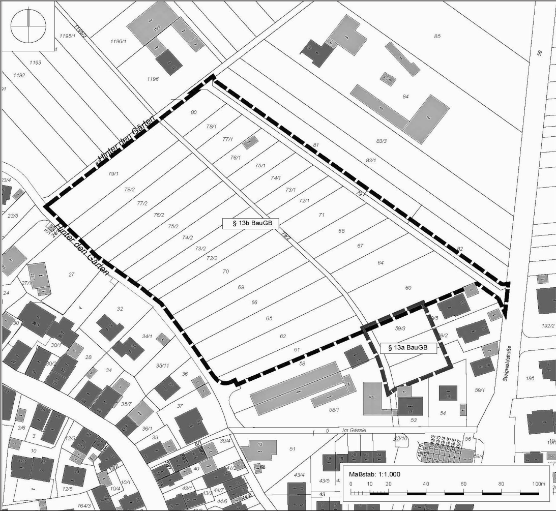
Übersichtsplan: Kartengrundlage Auszug Kartografie: © Städte-Verlag E.v.Wagner & J.Mitterhuber GmbH, 70736 Fellbach