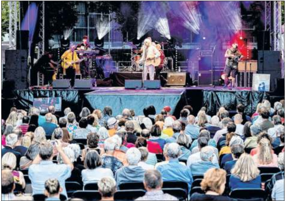
Damit das Leonpalooza ein sicherer Ort für alle Gäste ist, hat die Stadtverwaltung ein Sensibilisierungskonzept erarbeitet. Mit der Frage „Ist Leonie da?“ können sich Gäste an Mitarbeitende vor Ort wenden, wenn Hilfe gebraucht wird.

Wenn Gäste auf dem Leonpalooza bedrängt, belästigt oder angegriffen werden, ähnliches beobachten oder einen medizinischen Notfall melden wollen, können sie schnell und unauffällig auf diese Situation reagieren. Die Frage „Ist Leonie da?“ dient als diskreter Warnhinweis an die Leonpalooza-Mitarbeiterinnen und -Mitarbeiter vor Ort. Diese wurden im Voraus entsprechend geschult. Ohne Rückfragen bieten die Teamkolleginnen und -kollegen Hilfe an und bringen die hilfesuchende Person in einen geschützten Bereich. Dort werden dann die weiteren Schritte besprochen. Für die betroffene Person kann ein Moment Ruhe ausreichend sein. In anderen Fällen möchte der oder die Betroffene das Gelände verlassen. Wenn nötig, wird auch der Sicherheits- oder Sanitätsdienst hinzugezogen. Vor dem Hintergrund aktuell geführter Debatten zu Übergriffen auf Konzerten, ist ein solches Konzept aktueller denn je. Inzwischen ist es üblich, dass Veranstalterinnen und Veranstalter schon im Vorfeld Herangehensweisen für heikle Situationen ausgearbeitet haben. So auch auf dem Leonpalooza. Das Konzept der Stadtverwaltung Leonberg für das Leonpalooza 2023 zielt auf Awareness, also