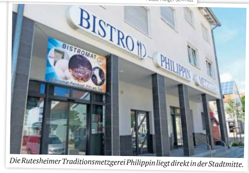
Die Rutesheimer Traditionsmetzgerei Philippin liegt direkt in der Stadtmitte.