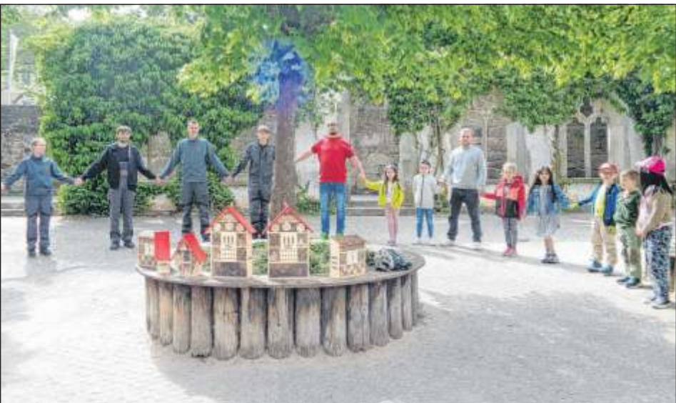
Zusammen mit Auszubildenden der Firma LEWA bauten die Vorschulkinder des Kinderhauses Spitalhof Insektenhotels.

Zur Stärkung gab es an diesem sonnigen Vormittag, passend zum Thema, leckere Honig- und Marmeladenbrote für alle Teilnehmenden sowie selbstgepressten Apfelsaft. Das gesamte Team des Kinderhauses Spitalhof bedankt sich recht herzlich bei der Firma LEWA für die langjährige gute Kooperation.