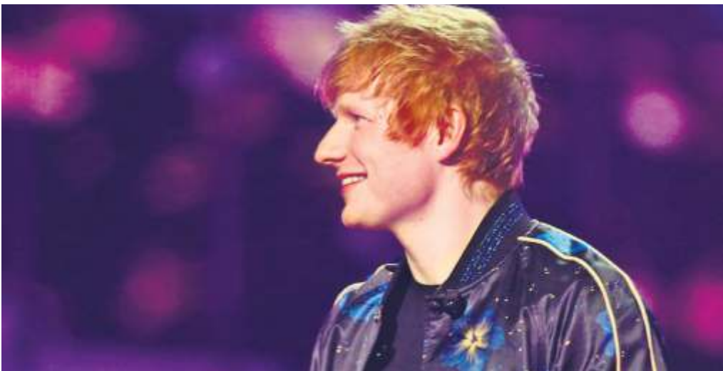
So liebt ihn sein Publikum: Ed Sheeran.

deren Genres wie Hip-Hop, Latin oder Rhythmic-Pop. Auf dem neuen Album kehrt er nun aber zurück zu den Anfängen seiner Karriere. So sah es sein Plan schon immer vor: Bereits vor zehn Jahren fasste Ed Sheeran den Entschluss, das perfekte Akustik-Album veröffentlichten zu wollen und begann, die ersten Songs für diese Platte zu schreiben und aufzunehmen. Doch dass das Schicksal anderes mit ihm vorhaben sollte, musste er im vergangenen Jahr erfahren. „Anfang 2022 gab es eine Reihe an Ereignissen, die mein Leben, meine psychische Gesundheit und letztlich die Art und Weise, wie ich Musik und Kunst betrachte, verändert hat. Innerhalb eines Monats bekam meine damals schwangere Frau die Diagnose