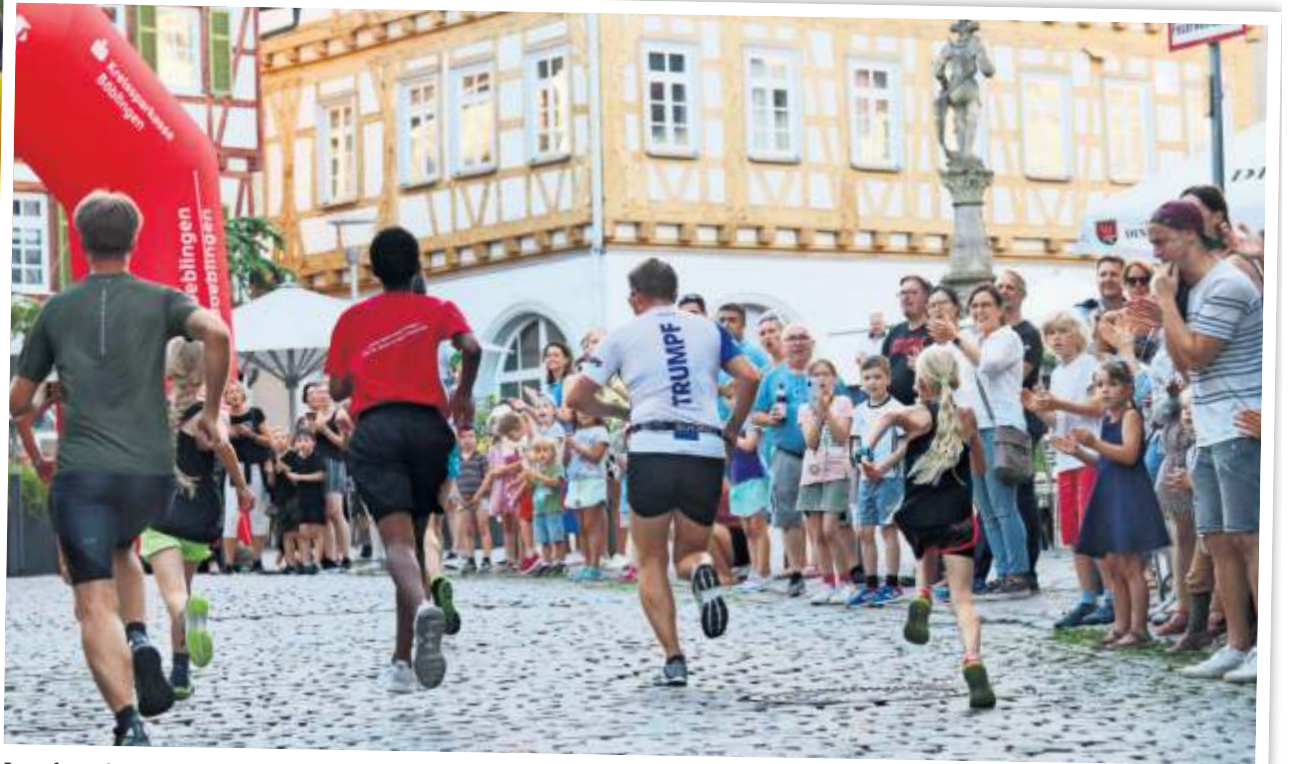
Leonberg läuft – in diesem Jahr am kommenden Samstag, 24. Juni