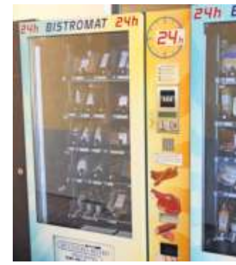
Der „Bistromat“ bietet Frisches rund um die Uhr – auch am Wochenende.