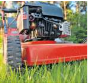
Wann soll man den Rasen mähen und was macht man am besten mit dem Rasenschnitt?

räumen und so dem Boden Nährstoffe entziehen, etablieren sich im Laufe der Zeit noch mehr Wildkräuter mit zahlreichen bunten Blüten. • Rauf aufs Beet: Der Rasenschnitt kann als Mulch-Material locker auf die Gemüsebeete oder um Beerensträucher gestreut werden. So kommen Wildkräuter nicht hoch und man spart sich das häufige Jäten. Außerdem schützt Mulchen vor dem Austrocknen des Bodens. • Naturnaher Gartenteich: Im Wasser tummelt sich Leben. Sie helfen damit Libellen, Vögeln und Amphibien, Lebensräume, Futter und Trinken zu finden. • Wasser anbieten: Im Sommer eine flache Schale Wasser im Garten aufstellen. Vögel, Wespen und andere Insekten können hier ihren Durst löschen. Legen Sie einen flachen Stein in die Schale, damit die Insekten auch wieder herauskommen. red