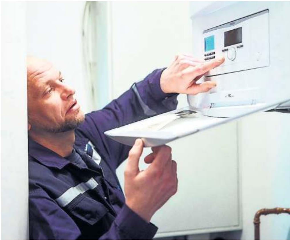
Heizungsanlage richtig einstellen – uns sie springt nicht ungewollt im Sommer an.

„Um bei den hohen Energiekosten wirklich auf der sicheren Seite zu sein, ist bei der Heizungsumstellung die richtige Grundeinstellung entscheidend.“ Darauf sollten Verbraucherinnen und Verbraucher jetzt achten: Viele moderne Heizungsanlagen mit smarter Regelung nehmen die Umstel-