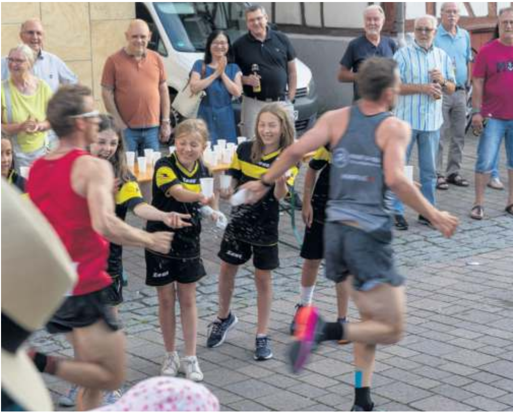
Für Verpflegung und jede Menge Stimmung ist beim Citylauf nicht nur in der Eltinger Carl-Schmincke-Straße auch in diesem Jahr wieder gesorgt.

Doch er schickt sogleich eine frohe Botschaft hinterher: „In Leonberg wird die 13. Auflage des Citylaufes am 24. Juni definitiv stattfinden, wir sind mit den Planungen und Vorbereitungen gut dabei.“ Welche Details den Ausschlag gaben, dass in Ludwigsburg die Reißleine gezogen werden musste? „Das entzieht sich unserer Kenntnis, wir können aber bestätigen, dass alles, was die Organisation eines Laufs durch