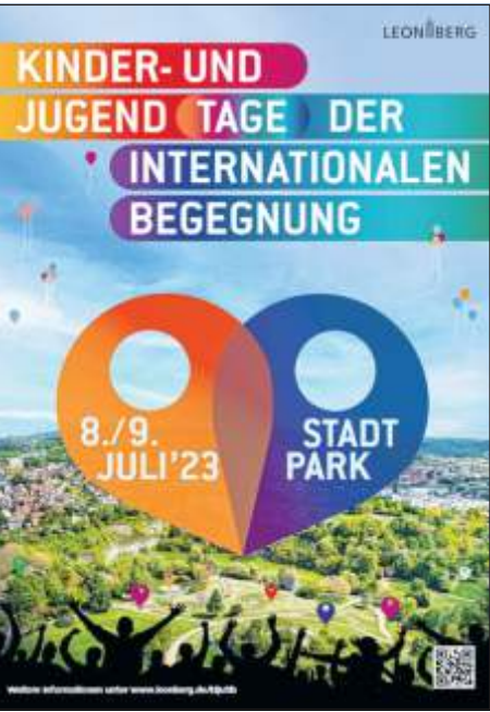
Zu den Kinder- und Jugendtagen und Tagen der internationalen Begegnung am Samstag, 8. Juli, und Sonntag, 9. Juli, wird ein vielfältiges Programm angeboten.