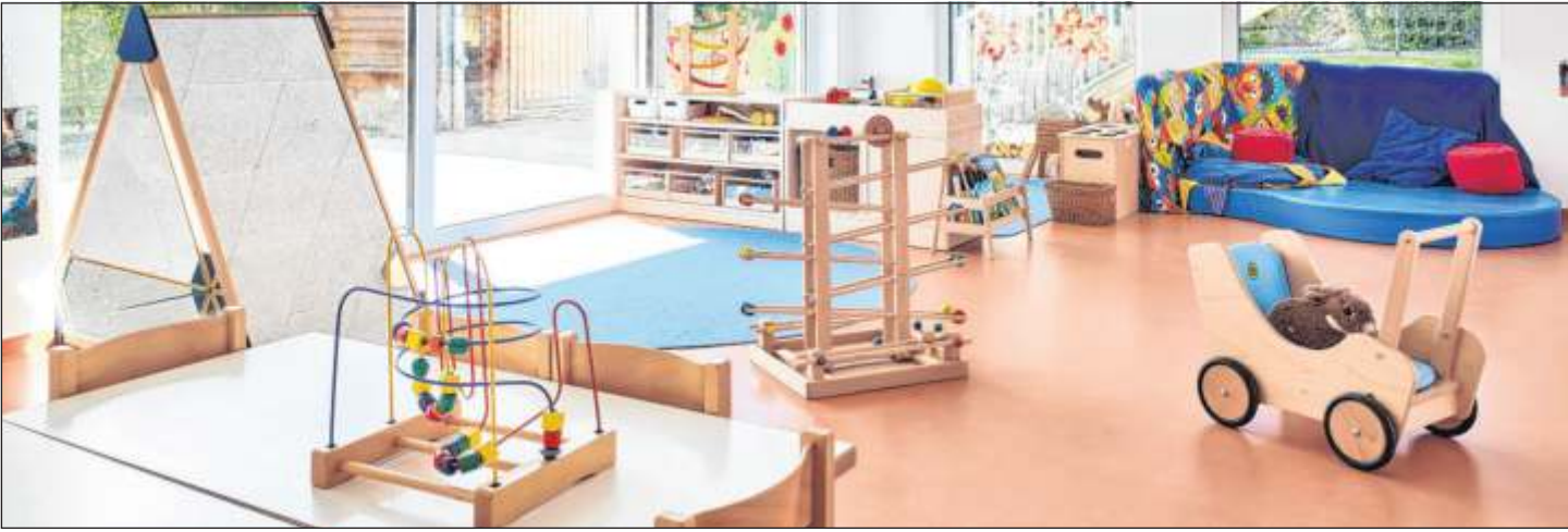
Für die Betreuung in Kitas, wie etwa dem Kinderhaus Warmbronn, fallen ab September höhere Gebühren an.

Die Eltern der städtischen Kitas wurden bereits Mitte Juni über die geplante Gebührenerhöhung informiert. Die neue Satzung über die Benutzung der Kindertageseinrichtungen der Stadt Leonberg wird auf dieser Amtsblatt-Seite veröffentlicht. Die Satzung über die Benutzung der Schulkindbetreuung wird in einer der kommenden Amtsblatt-Ausgaben abgedruckt. Eltern erhalten zeitnah einen neuen Gebührenbescheid, der sich auf die neuen Satzungen bezieht und die neuen Gebühren ausweist. Die neuen Gebühren gelten ab 1. September 2023.