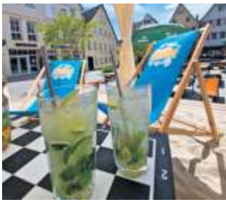
Ist das nicht herrlich, ein schattiges Plätzchen mit einem kühlen Getränk beim Weiler Sommer in Weil der Stadt.

Der „Sommer an der Glens“ wird in der Kernstadt Ditzingen in der Ortsmitte, nahe der Marktstraße, zwischen Glens- und Bauernstraße, gefeiert. Die Spielleiter von Spiel-o-Top laden an den Dienstagen 8., 15. und 22. August Kinder und Familien zu verschiedenen Spielangeboten ein, etwa zu Großbrettspielen