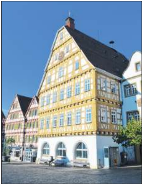
Die Öffnungszeiten im Standesamt im Alten Rathaus müssen aufgrund von Personalmangel angepasst werden.

Montags, dienstags und donnerstags sind weiterhin Besuche ohne vorherige Terminvereinbarung möglich. Das Standesamt empfiehlt aber auch für diese Tage Termine zu vereinbaren, um Wartezeiten zu verhindern. Das Standesamt ist montags und dienstags von 8 bis 12 Uhr und 14