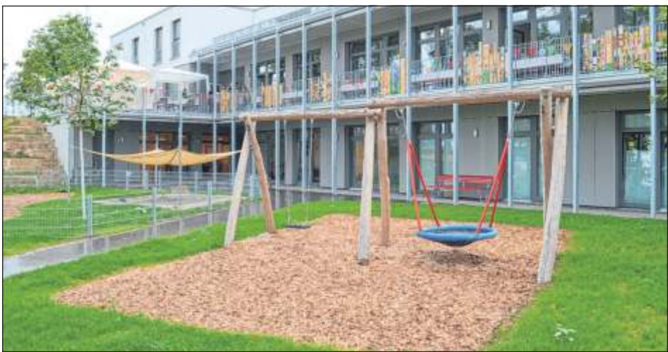
Das Kinderhaus Nord konnte am Freitag, 28. Juli, besichtigt werden.

Im Haus waren verschiedene Spielstationen aufgebaut, die von den Erziehern und Erzieherinnen begleitet wurden. Die Kinder konnten sich schminken lassen oder an der Seifenblasenstation experimentieren und gemeinsam mit ihren Eltern an Wettspielen teilnehmen. Auf der Terrasse standen dekorierte Tische, die durch Pavillons geschützt waren. So konnten die immer wiederkehrenden Regenschauer der guten Stimmung keinen Abbruch leisten. Für Groß und Klein gab es Getränke, Kaffee und Kuchen, den die Eltern der Kita Nord gebacken hatten.