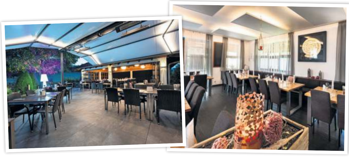
Das Hotel Zehnbrunnen überzeugt mit der schönen und vielseitigen Location mit Garten.