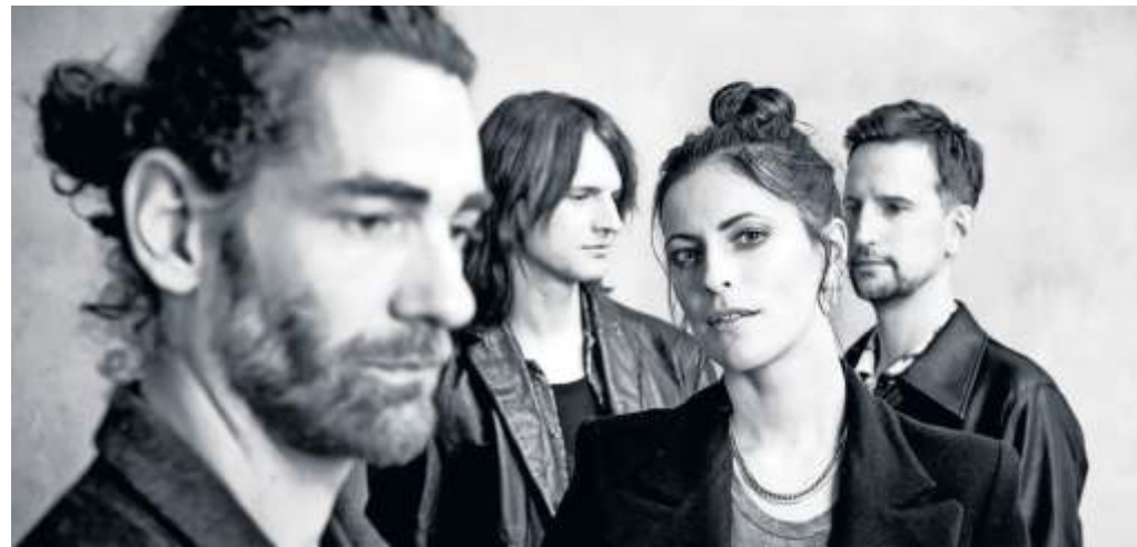
Silbermond will mit „Auf auf“ seinen Fans Mut und Hoffnung geben.