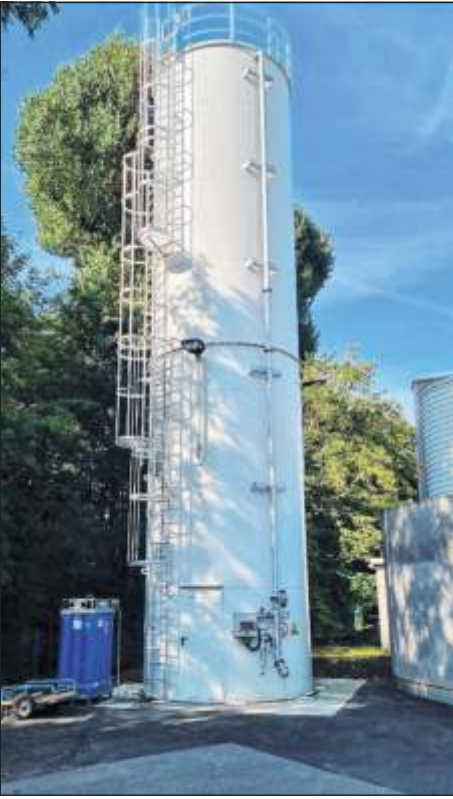
Pulveraktivkohle-Silo auf der Kläranlage Mittleres Glemstal.

Durch Untersuchungen war es zudem möglich, die Dosierung der Pulveraktivkohle zu optimie-