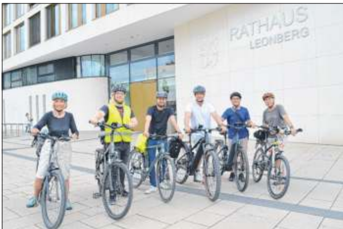
Beim STADTRADELN 2023 kamen insgesamt 152.335 Kilometer zusammen. Im Rahmen der Aktion fand unter anderem auch eine Auftaktfahrt sowie ein kostenfreier Radcheck auf dem Parkplatz des Neuen Rathauses statt.