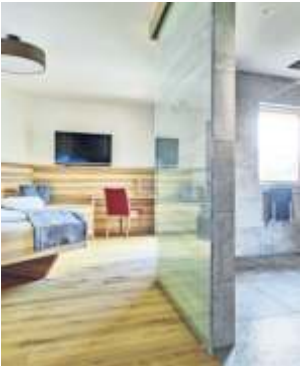
Eine barrierefreie Wohnung erleichtert im Alter den Alltag enorm.

Kochen, Lebensmittel zubereiten oder Geschirr spülen: Mit körperlichen Einschränkungen oder im Alter werden diese Tätigkeiten oft zum Kraftakt. Um diese Handgriffe zu erleichtern, gibt es unterfahrbare Arbeitsplatten. Diese gibt es ab etwa 1.400 Euro. So kann auch im Sitzen gekocht werden. Bei Backöfen bieten sich Modelle mit umschwenkbaren Türen und Auszugstableau an. Elektrogeräte gilt es allgemein höher zu positionieren.