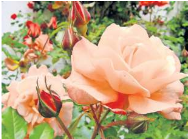
Im Frühjahr brauchen Rosen einen wachstumsfördernden Schnitt.

sowie Verblühtes immer zeitnah entfernen. Die meisten Rosen können sowohl im März als auch im Juli nach der Hauptblüte mit einem passenden organischen Dünger versorgt werden, damit die Pflanzen gegen Schädlinge und Pilzbefall gestärkt sind und entsprechend wachsen können. Zudem profitieren Rosen von einer maximal 10 Zentimeter dicken Schicht Rindenmulch rund um den Stamm. Das verhindert das Aufkommen von Unkräutern und erhält die Feuchtigkeit im Boden. Wichtig ist jedoch, dass die Düngung der Pflanze vor dem Mulchen erfolgt, damit die Nährstoffe die Pflanzenwurzel auch erreichen. red