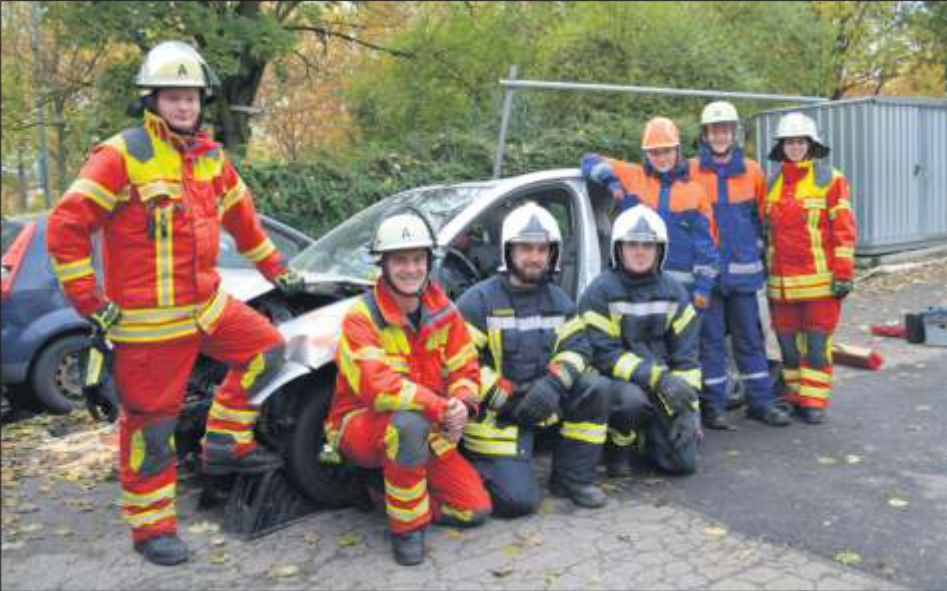
Gemeinsame Übungen standen beim Austausch mit der Jugendfeuerwehr Rovinj auf dem Programm.

Ein Mitglied der Rovinjer Jugendfeuerwehr steht nach vorn gebeugt vor einem alten Opel Corsa. Er presst das große Spreizgerät zwischen Beifahrertür und T-Säule. Es knackt, die Scheibe zersplittert. Die Tür springt auf und fällt zu Boden. Beim Besuch der Partnerfeuerwehr aus Rovinj stehen Übungen wie diese ganz oben: Voneinander lernen, Erfahrungen austauschen und gemeinsam trainieren. Doch auch außerhalb der Feuerwehrtätigkeit unternehmen die Männer und Frauen Verschiedenes: Am Sonntag 29. Oktober, haben die kroatischen und deutschen Feuerwehrleute den Leonberger Ortsverband des Technischen Hilfswerks besucht. Natürlich durften auch der Engelberturm und das Schloss Solitude nicht fehlen. Am Montag führen sie nach Ludwigsburg und nahmen das Barockschloss bei einer Führung unter die Lupe. Der Dienstag war mit Feuerwehrrübungen gefüllt, ehe am Mittwoch ein großes Abschlussfrühstück stattfand.