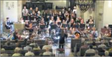
Das Barock-Ensemble '83 in einer Kirche.