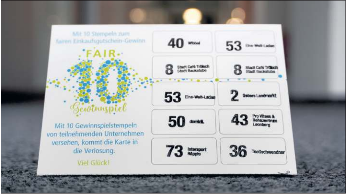
Mit zehn Stempeln kann eine Karte eingereicht werden.

Seit 2013 ist Leonberg als „Fairtrade-Stadt“ zertifiziert. Anlässlich des Jubiläums haben Bürgerinnen und Bürger die Chance auf einen von 50 Einkaufsgutscheinen für teilnehmende Betriebe.