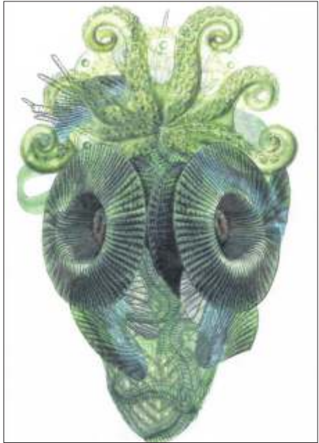
Gudrun Brückel zeigt bei ihrer Ausstellung „Prototypen“ im Galerieverein Collagen, Drucke und Objekte. Grafik: Gudrun Brückel

Ausstellungseröffnung ist am Sonntag, 19. November, 11.15 Uhr. Zur Eröffnung spricht Karin Eisenkrein von der grafischen Sammlung der Staatsgalerie Stuttgart. Die öffentlichen Führungen durch die Ausstellung finden am Sonntag, 26. November, und Sonntag, 17. Dezember, jeweils um 15.30 Uhr, statt. Der Eintritt ist frei, eine Voranmeldung ist nicht erforderlich. Termine für Gruppen und Schulklassen können auf Anfrage organisiert werden.