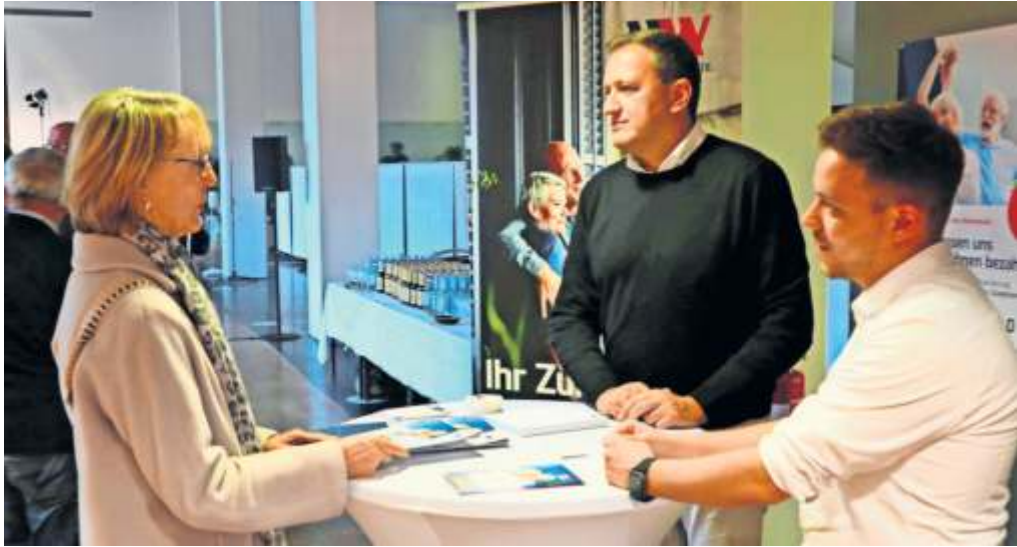
Was bringt eine Immobilienrente, soll man eine anlegen? Experten geben im Pressehaus in Stuttgart-Möhringen Antworten auf die Fragen der Gäste.

■ MÖHRINGEN Was ist eigentlich Immobilienverrentung und worauf lohnt es sich zu achten? • Lohnt sich eine Immobilienrente? • Wie hoch ist die Immobilienrente? • Kann ich mein Haus verkaufen und trotzdem drin wohnen bleiben? • Ist eine Immobilienrente steuerpflichtig? Diese und weitere Fragen erläutern Experten in einer Podiumsdiskussion am Montag, 20. November, ab 18 Uhr im Pressehaus Stuttgart, Plieninger Straße 150. Das Abendticket kostet 5 Euro (Karten unter zeitung-erleben.de/immobilien oder an der Abendkasse). Auch für eine persönliche Beratung, stehen den Teilnehmenden die Experten der Immobilienverrentung an diesem Abend zur Verfügung. Das Thema Immobilienverrentung gewinnt als Mittel der Altersfinanzierung immer mehr an Beliebtheit. Zwar wohnt jeder zweite Senior in den eigenen vier Wänden, aber oft haben auch Senioren mit Immobilieneigentum finanzielle Sorgen oder wissen nicht, wie mit einer Pflegesituation umgegangen werden soll. Für rund jeden dritten Immobilienbesitzer über 50 Jahre macht die Immobilie zwei Drittel des Gesamt-