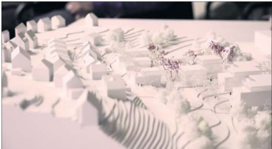
Das Modell zum Plangebiet Unterer Schützenrain.

Die meisten Besucherinnen und Besucher, die am 5. Oktober vor Ort waren, leben in unmittelbarer Umgebung des geplanten Baugebiets. Sie trugen ihre Bedenken sowie Anregungen und Fragen vor. Ein Schwerpunkt beschäftigte sich mit den Auswirkungen auf den Verkehr im Gebiet, die eine neue Kita mit sich bringt.