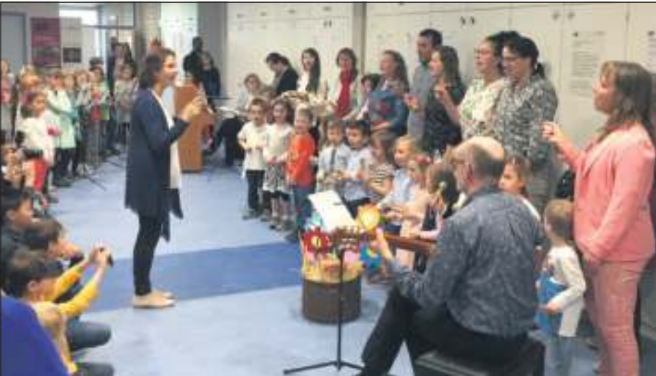
Anmeldungen zur Jugendmusikschule sind ab sofort möglich. Die Einteilung der Schülerinnen und Schüler zum Sommersemester erfolgt ab Mitte Dezember.

Am 1. März 2024 beginnt das Sommersemester. Zusätzlich zum Unterrichtsangebot in den Hauptstellen Lindenbergerstraße 16 und 18, sowie der Georgii-Halle (weitere Unterrichtsorte befinden sich unter anderem an der Marie-Curie-Schule, der Sophie-Scholl-Schule, der Mörikeschule und der Spitalschule) wird auch in einigen Fächern Unterricht in den Teilorten Gebersheim, Warmbronn und Höfingen angeboten. Interessenten des Angebots der Jugendmusikschule sollten sich spätestens jetzt an- oder abmelden. Bereits ab Mitte Dezember 2023 erfolgt dann die Einteilung der Schülerinnen und Schüler, die zum Sommersemester ab März 2024 mit dem Unterricht beginnen wollen. In den Fächern Eltern-Kind-Gruppe und Rhythmik in Leonberg und Warmbronn, ebenso wie in den Fächern Kontrabass, Oboe, Posaune und Saxophon sind ab März 2024 voraussichtlich noch einzelne Plätze vorhanden. Zusätzlich bietet die Jugendmusikschule ein besonders flexibles Angebot für Erwachsene an, die gerne ein Instrument spielen würden, aber nicht regelmäßig Zeit für den Musikunterricht haben: „Es gibt für Erwachsene 4er- und 8er-Karten“,