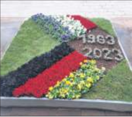
Deutsch-französisches Blumenbeet zum 60. Jubiläum des Elysée-Vertrags.

an Sonn- und Feiertagen und während der Nachtzeit: Anita Martin, Telefon: 07152 903095 Albert Sauter, Telefon: 07152 25-247 oder 25-352 Michael Berthold, Telefon: 07152 354266 Bestattungshaus Haller, Telefon: 07152 3325737 Kick & Groshaupt Bestattungen GmbH, Telefon: 07152 7644966