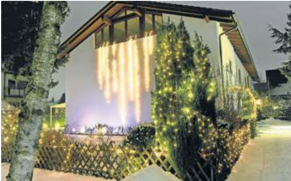
Solange die Nachbarn nicht belästigt sind, sind Lichterketten am Haus in Ordnung. Eine einfache Lösung ist oft eine Zeitschaltuhr.

In der Adventszeit glitzert, funkelt, blinkt und leuchtet es überall. Für viele gehören Lichterketten und Leuchsterne auf dem Balkon oder am Fenster fest zur Vorweihnachtszeit dazu. Meist ist das kein Problem. „Solange Mieter beim Aufhängen der Beleuchtung die Fassade nicht beschädigen und sie das äußere Gesamtbild des Hauses nicht übermäßig stören, ist das Schmücken erlaubt“, so Sabine Brandl. „Mieter sollten allerdings darauf achten, dass das Licht nicht zu hell ist oder die ganze Nacht hindurch blinkt und dadurch die Nachbarn belästigt.“ Sonst