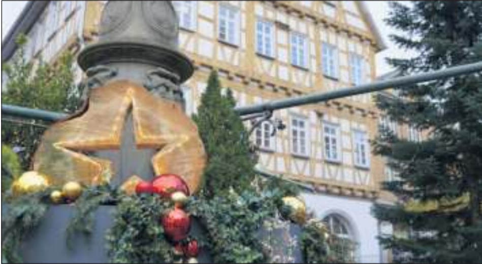
An den kommenden drei Wochenenden wird es beim Adventsdörfle rund um den Marktplatz wieder weihnachtlich. Auch in den Ortschaften finden dieses und nächstes Wochenende Weihnachtsmärkte statt.

Die Weihnachtsmarkt-Saison steht in Leonberg kurz bevor. Ab Freitag, 1. Dezember, bieten sich in der Engelbergstadt sowie in den Teilorten mehrfach Gelegenheiten, um bei Glühwein, Punsch und traditionellen Leckereien in Weihnachtsstimmung zu kommen. Ausführliche Informationen finden Interessierte auch auf www.leonberg.de/Advent-in-Leonberg .