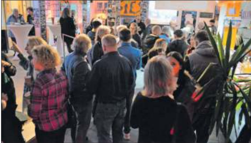
Rund 70 Gäste feierten das 25-jährige Bestehen der Jugendsozialarbeit Kernstadt der Waldhaus gGmbH im Jugendcafé Siesta in Leonberg.