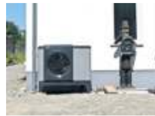
Sparen für das Wohneigentum bedeutet auch: Geld zurücklegen – zum Beispiel für eine Heizanlage auf der Basis erneuerbarer Energien.