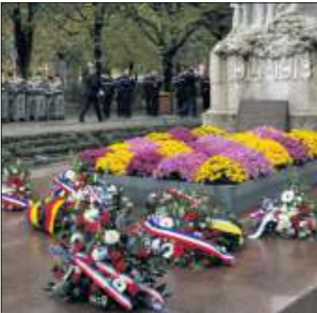
An der Gedenkfeier zum Waffenstillstand des Ersten Weltkriegs wurden zahlreiche Kränze niedergelegt.

Am Morgen des 11. November 1918 wurde in einem Eisenbahnwaggon im Wald von Compiègne das Waffenstillstandsabkommen unterzeichnet, das faktisch den mehr als vier Jahre dauernden Ersten Weltkrieg beendete. Um 11 Uhr trat der Waffenstillstand in Kraft. Der 11. November ist in Frankreich ein Feiertag, an dem zahlreiche Feierlichkeiten im ganzen Land stattfinden.