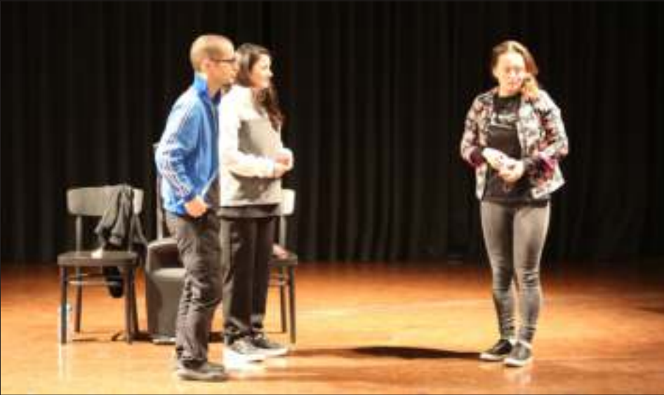
Rund 400 Schülerinnen und Schüler der Gerhart-Hauptmann-Realschule und des Albert-Schweitzer-Gymnasiums konnten bei „Theater im Kreis“ Theaterluft schnuppern.

Seit 31 Jahren findet im Landkreis Böblingen das Kinder- und Jugendfestival „Theater im Kreis“ statt. Es wird vom Kreisjugendreferat im Landratsamt Böblingen und vom Kreisjugendring Böblingen e.V. organisiert. Ende November war es wieder soweit und die Theaterwoche stand an: Von Montag, 20. bis Freitag, 24. November, wurden im gesamten Landkreis verschiedene professionelle Theaterstücke vor Schülerinnen und Schülern aller Altersklassen aufgeführt.