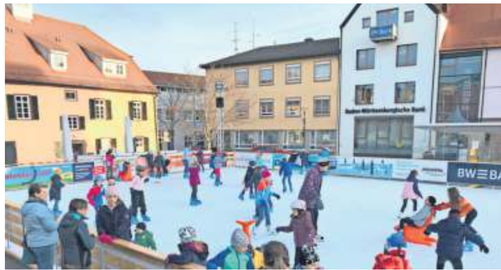
Eislaufspaß auf dem Gerlinger Rathausplatz. Die Gerlinger haben sich riesig auf ihre Eisbahn gefreut, nach vier Jahren Pandemiepause ist es endlich wieder soweit, die Eisbahn ist bis zum 7. Januar in Betrieb.