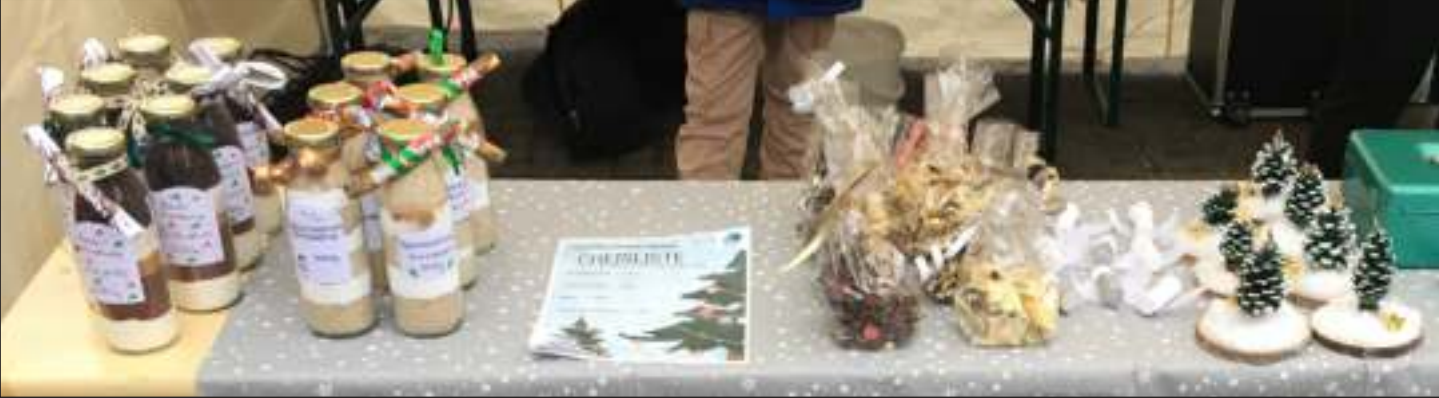
Im vergangenen Jahr haben die Kinder und Jugendlichen gemeinsam mit den Mitarbeitenden der Kinder- und Jugendarbeit Höfingen Backmischungen, kleine Tannenbaumlandschaften, und Weihnachtscrunch verkauft. Auch dieses Jahr wird Selbstgemachtes verkauft.

wird Kinderpunsch und warme Waffeln geben. Weihnachtsspiele dürfen da auch nicht fehlen. Alle Kinder im Grundschulalter dürfen sehr gerne bei der Weihnachtsfeier dabei sein. Nach den drei Veranstaltungen wird sich das Jugendhaus vom 21. Dezember bis 8. Januar 2024 in die Weihnachtsferien verabschieden. Die Mitarbeiterinnen und Mitarbeiter der Kinder- und Jugendarbeit Höfingen freuen sich, euch bei den Veranstaltungen im Dezember zu sehen.