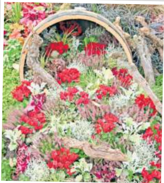
Ruhestätte für einen Winzer: Ein Weinfass zierte das Grab und verleiht ihm eine individuelle Note.

Ein dezentere Weg zu mehr Intimität mit dem Verstorbenen kann die Bepflanzung sein. Christoph Killgus rät Angehörigen, das Grab mit dem zu bepflanzen, was sie gerne haben oder was sie in ganz persönlicher Weise an den Verstorbenen erinnert –