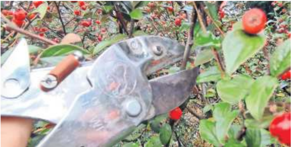
Auch die roten Beeren der Mispel bringen im Winter Farbe in den Garten – oder ins Haus, Foto: Agentur LMZ

Ist das herbstliche Blattfeuerwerk vorüber, weichen in vielen Gärten die Farben einem trübseligen Wintergrau. Dem lässt sich abhelfen – mit einer bekannten Auswahl der Pflanzen. Da diese mitsamt der Anlage von Beeten und Wegen schnell ins Geld gehen, gleich ein Tipp: Für die Neuanlage eines Gartens lässt sich Geld aus einem Bausparvertrag verwenden, denn hier handelt es sich um einen wohnwirtschaftlichen Zweck. Wer sich also ins nächstgelegene Gartencenter aufmacht, sollte sich zunächst nach Immergrünen wie Eibe, Stechpalme oder Efeu umschauen. Eibe und weibliche Stechpalme schmücken sich mit roten Früchten, Efeu mit blauschwarzen. Auf diese muss man allerdings wenigstens zehn Jahre warten, denn Efeu blüht und fruchtet erst im Alter. Über Blüten und Früchten zum Saisonende freuen sich natürlich auch Insekten und Vögel, wird das Nahrungsangebot doch langsam knapp. Immergrüne fielen in der kahlen, kalten Winterzeit schon immer