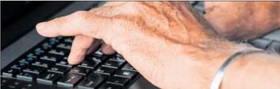
Beim Computer Club lernen Seniorinnen und Senioren den Umgang mit Hard- und Software kennen.

Hilfe für Seniorinnen und Senioren beim Umgang mit den neuen Medien. Die ehrenamtlichen Betreuer bringen viel Geduld mit und haben Erfahrungen mit vielen typischen Problemen. Bei Fragen zu PC, Notebook, Tablet oder Smartphone, kann bestimmt weitergeholfen werden. Das eigene Gerät kann gerne mitgebracht werden. W-Lan ist vorhanden. Fragen zu Programmen und Apps können ebenfalls geklärt werden. Das