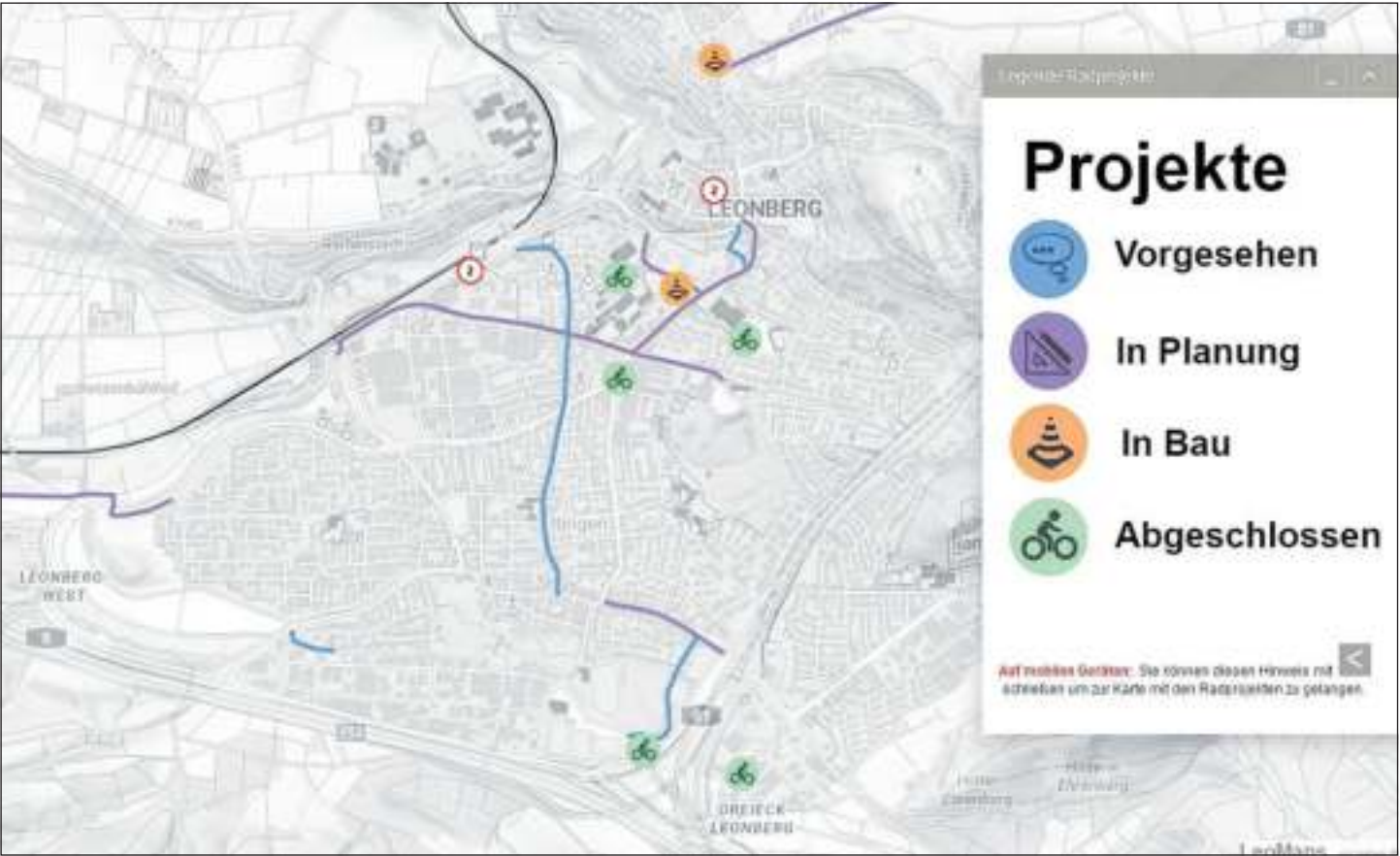
In LeoMaps sind die Projekte auf einer Karte interaktiv dargestellt.

Radprojekte interaktiv auf LeoMaps darzustellen ist eine Möglichkeit, Bürgerinnen und Bürgern Einblicke in die Arbeit der Stadtverwaltung zu geben. Die Radinfrastrukturprojekte werden schon lange vor der Baumaßnahme sichtbar gemacht. Gerade bei größeren Planungsprojekten können Interessierte auf diese Weise die Entwicklung nachverfolgen, bevor das Vorhaben auch durch bauliche Maßnahmen erkennbar wird.