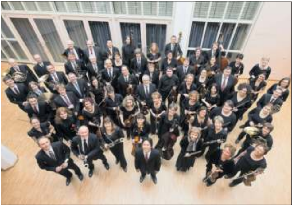
Das Sinfonieorchester Leonberg im Foyer der Stadthalle.

Karten kosten je nach Kategorie 25, 22 und 20 Euro und sind noch im i-Punkt, in der Stadthalle und bei Reservix erhältlich. Schülerinnen und Schüler, Studierende und Schwerbehinderte zahlen die Hälfte des jeweiligen Eintrittspreises.