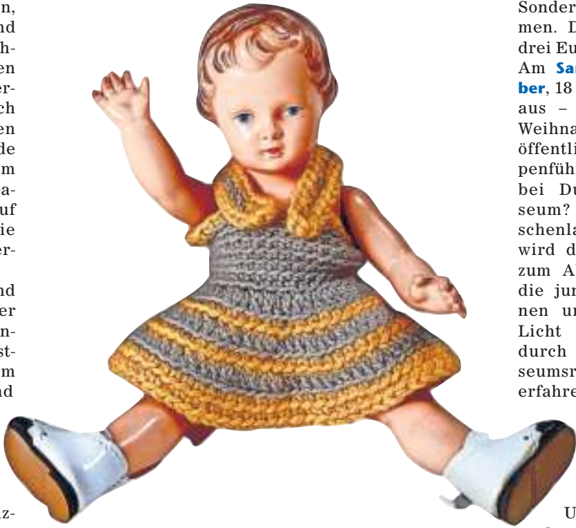
Die nostalgische Schildkröt-Puppe ruft Emotionen ab, die es eben nur an Weihnachten gibt.

Als Museum der Deutschen aus Ungarn wirft die Ausstellung zudem einen Blick auf typisch ungarndeutsche Traditionen. Weit verbreitet ist das Christkindspiel, bei dem Kinder von Haus zu Haus ziehen, um die Weihnachtsgeschichte zu erzählen. Hierzu werden Leihgaben aus dem Ungarndeutschen Museum