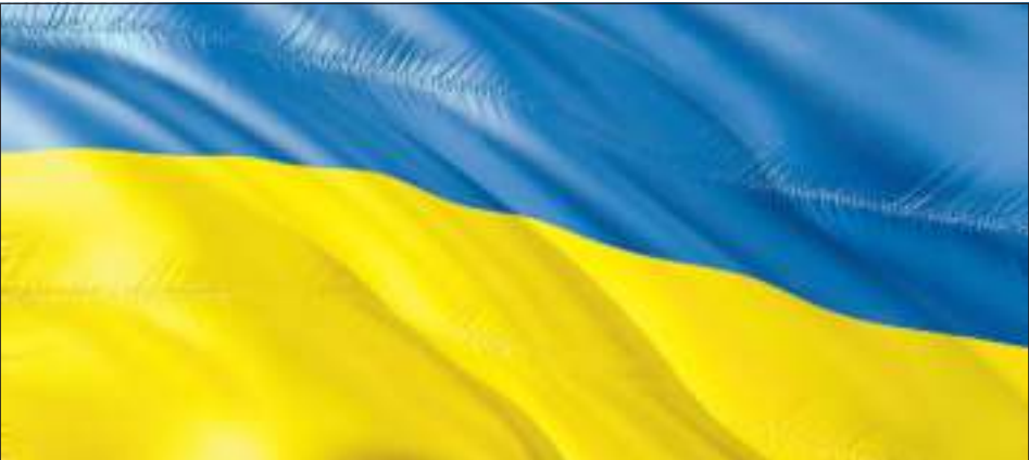
Durch eine neue Bundesverordnung werden Aufenthaltstitel ukrainischer Bürgerinnen und Bürger automatisch bis zum 4. März 2025 verlängert.

Aufenthaltstitel ukrainischer Bürgerinnen und Bürger, die am 1. Februar 2024 gültig sind, werden automatisch bis 4. März 2025 verlängert. Es ist keine Vorsprache bei der Stadtverwaltung notwendig.