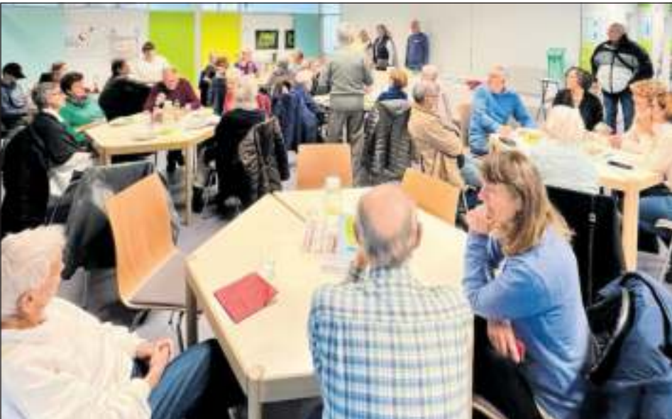
Rund 70 Gäste kamen Ende November zu „Leo-Mitte isst“ ins Bürgerzentrum Stadtmitte.

geworden. Das Veranstaltungsformat „Leo-Mitte isst“ bietet Raum für Begegnung, ermöglicht ein Kennenlernen und bietet die Möglichkeit Kontakte zu knüpfen. Eine Spende der Robert Bosch GmbH in Leonberg hat die Veranstaltung finanziert. Der Kreis der Unterstützer und Unterstützerinnen wird immer größer und begeistert die freiwillig Engagierten sowie die Quartierskordinatorinnen. So spendeten beispielsweise die Landfrauen aus Leonberg Stollen für den bevorstehenden vorweihnachtlichen Kaffeenachmittag. Auch die Stadt Leonberg unterstützt die Quartiersarbeit.