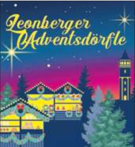
Illustration: Stadt Leonberg

Marktplatzhütte: SV Leonberg/Eitingen Abt. Jugendfußball