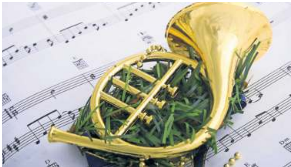
Mit Hörnern, Pauken und Trompeten: bis und an den Feiertagen darf man sich an Liedern und Klängen erfreuen.

In Weil der Stadt steht das Programm fürs Kirchenkonzert, wenn der Musikverein Weil der Stadt Stadtkapelle am Sonntag, 17. Dezember, ab 18 Uhr in der katholischen Kirche St. Peter und Paul auf dem Programm steht. Zur Eröffnung erklingt die „Toccata for Band“ des US-Komponisten Frank Erickson. „Pacem“ – eine Hymne für den Frieden von Robert Spittal schließt sich an. Die Film- und Musik „La Storia“ von Jacob de Hahn wird ebenso erklingen wie „Cinderella's Dance“, komponiert von Karl Svoboda, die die Geschichte von Aschenbrödel erzählen. Am Ende darf man ins „O Sanctissima!“ von Markus Götz einstimmen, das „O du fröhliche“ als Hauptmotiv hat. In Leonberg heißt es bereits am heutigen Mittwoch, 13. Dezember, „Eine halbe Stunde Musik + Text in der Adventszeit“ , Beginn um 18.15 Uhr, mit dem Organist Michael Schau und der Cellistin Zili Yu. Das Adventssingen und der Christbaumverkauf im Seehaus Leonberg am 15. Dezember hat ebenfalls Tradition: Das Singen beginnt um 17 Uhr vor der lebendigen Krippe. Am 16. Dezember ist das Jahresabschlusskonzert der MV Stadtkapelle Heimsheim in der Stadthalle Heimsheim ab 18 Uhr. Der Sängerbund Rutesheim veranstaltet einen Tag später, am 17. Dezember, 17 Uhr, sein weihnachtliches