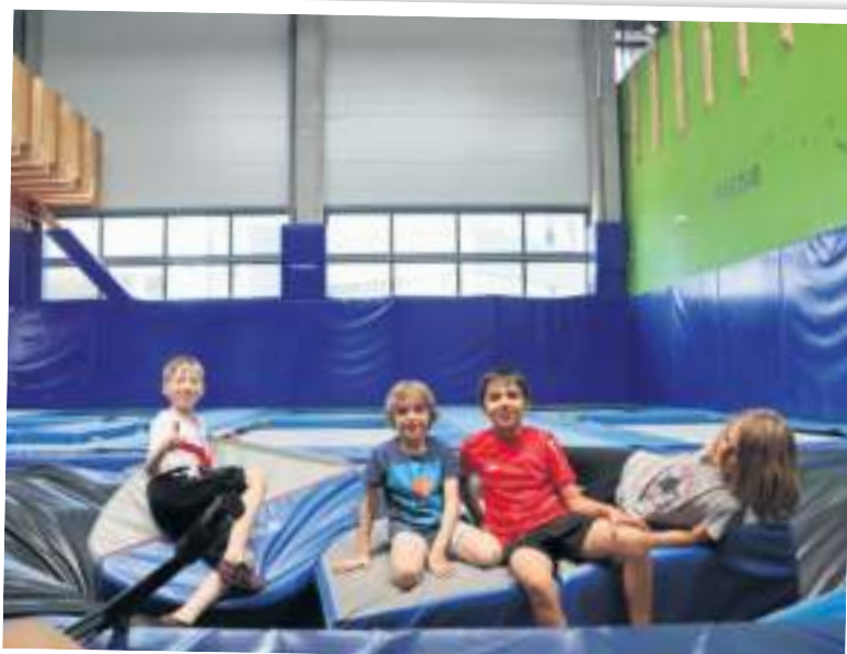
Die Freestyle Academy bietet ausreichend Möglichkeiten für alle, die sich gerne bewegen.

Neben dem normalen Eintritt werden Monats- oder Jahres-Abos angeboten. Zum bevorstehenden Weihnachtsfest bieten sich auch online abrufbare Wertgutscheine als Geschenk an.