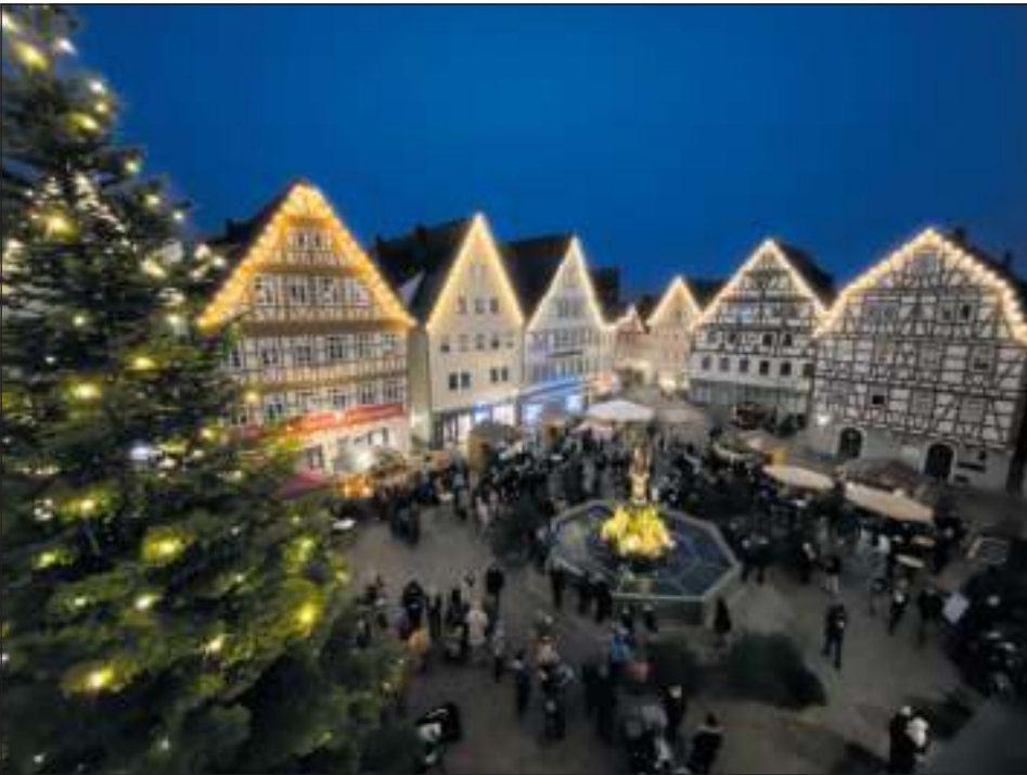
In den Weihnachtsferien sind einige städtische Einrichtungen wie etwa das Bürgeramt am Marktplatz nur eingeschränkt geöffnet.