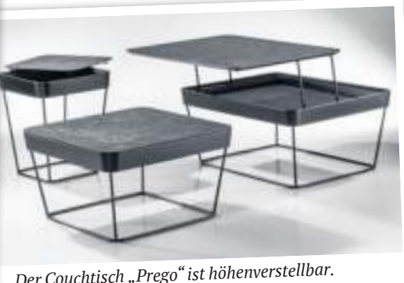
Der Couchtisch „Prego“ ist höhenverstellbar.

KONTAKT M. + W. Bacher GmbH Benzstraße 23 71272 Renningen Telefon: 0 71 59 / 1 60 40 Mail: info@bachertische.de www.bachertische.de