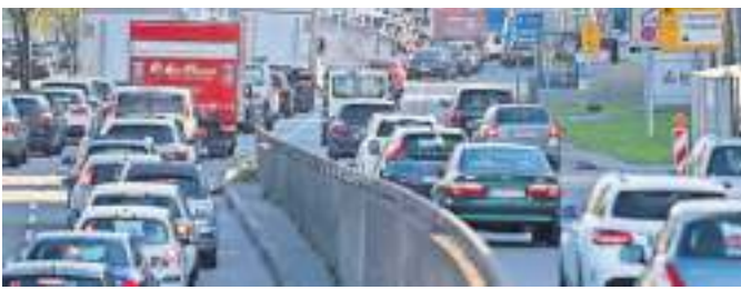
Stau in Stuttgart, der nervt vor allem Pendlerinnen und Pendler sehr, wie die jüngste Befragung des ADAC ergab.

Im Vergleich zu 2017, als man die Untersuchung schon einmal durchgeführt hat, hat sich vor allem die Zufriedenheit mit dem Baustellenmanagement stark verschlechtert. Die Dresdner scheinen hingegen ziemlich glücklich zu sein mit ihren Verkehrswegen, die auch per Rad, zu Fuß oder im ÖPNV untersucht wurden. „Wir denken bis 2045 voraus, treiben aber auch viele Projekte voran, die sich schnell umsetzen lassen“, sagt Frank Fiedler, der die städtische Verkehrsentwicklungsplanung in der Stadt an der Elbe leitet. Außerdem setzt er auf Mobilitätspunkte: Mehr als 60 dieser Schnittstellen zwischen ÖPNV, (Lasten-)Radverleih und Carsharing mit E-Ladesäulen für Autos sind seit 2018 in der Elbmétropole entstanden. Sie sollen es den Bürgerinnen und Bürgern erleichtern, zwischen verschiedenen Verkehrsmitteln zu wechseln. „Worauf wir vor allem stolz sind, ist das Angebot mit einem E-Scooter-Anbieter, mit dem wir zusammenarbeiten und das Mobilitäts-Shuttle für abends, wenn