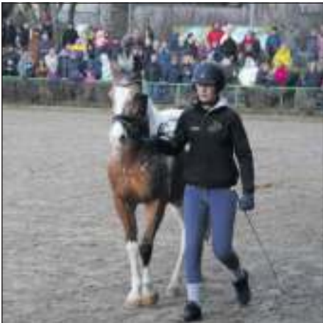
Im Reiterstadion wurden bei der Pferdeschau am Sonntag Kleinpferde prämiert.