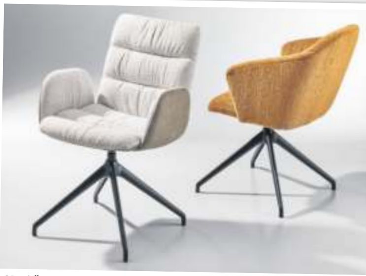
„Noah“ (rechts) und „Aiden“ sind mit entspannungsfördernden Schaukel-Untergestell und Drehmechanik ausgestattet.

che Ausstellungs- und Auslaufartikel als Schnäppchen aus der Kollektion.