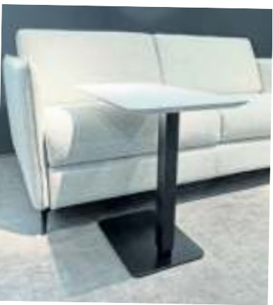
„Workform“ kann als Beistell- oder Arbeitstisch genutzt werden.