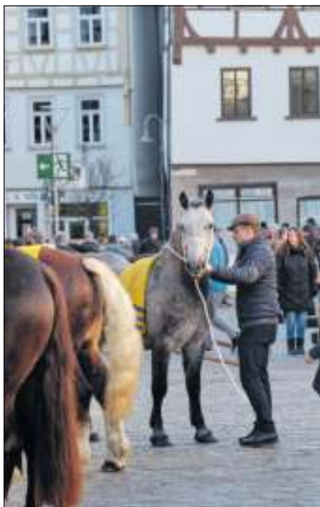
Der Pferdehandel fand wieder auf dem Marktplatz statt.

Zum 331. Mal feierte Leonberg zwischen Freitag, 9. Februar und Dienstag, 13. Februar, seine ganz eigene fünfte Jahreszeit – den Pferdemarkt. Allein am Dienstag kamen mehr als 22.000 Menschen in die Engelbergstadt. Oberbürgermeister Martin Georg Cohn bedankt sich bei allen Beteiligten