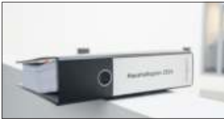
Der Haushalt wurde vom Regierungspräsidium Stuttgart genehmigt.

Das Regierungspräsidium Stuttgart hat am Freitag, 9. Februar, den städtischen Haushalt genehmigt. Das Zahlenwerk, das vom Gemeinderat am 19. Dezember 2023 beschlossen wurde, umfasst Erträge im Ergebnishaushalt von rund 180 Millionen Euro, Aufwendungen von rund 183 Millionen Euro und Investitionen im Finanzhaushalt von rund 43 Millionen Euro.