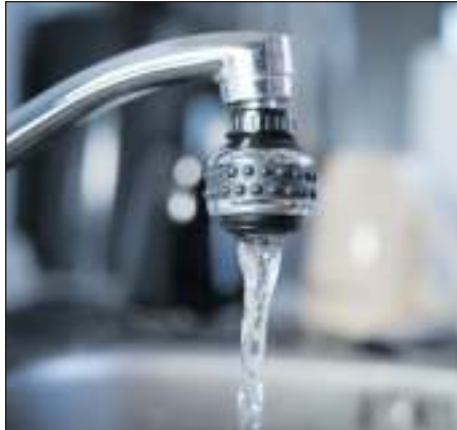
Die Verbrauchspreise des Wassers müssen erhöht werden.

Die Bodensee-Wasserversorgung unternimmt Maßnahmen, um die Population möglichst zu begrenzen. Doch viele Rohre müssen bereits saniert werden. Die Kosten sind hoch und gehen wohl in die Millionen. Ein Teil der Kosten wird auch auf die Stadt Leonberg umgelegt. Der Gemeinderat beschäftigte sich in seiner jüngsten Sitzung damit, wie die Kosten am verträglichsten an die Bürgerinnen und Bürger weitergegeben werden können. Das Ergebnis: die jährliche Grundgebühr von 42 Euro verändert sich nicht. Anders bei der Verbrauchsgebühr. Sie steigt ab 1. März von bisher 2,20 auf 2,43 Euro.