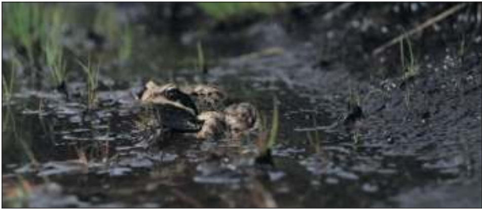
Derzeit sind viele Amphibien unterwegs, auch Frösche.