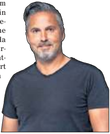
das? Weil mit dieser einen Idee etwas Wesentliches erreicht wurde: Aus schüchternen Kindern wurden

Ein junger Lehrer am Schönbuch-Gymnasium in Holzgerlingen hatte vor vielen Jahren die Idee, eine Zauber-AG anzubieten, da er zwei ungenutzte Zauberkästen bei sich zuhause hatte. Auf einer Klassenfahrt nach Paris zog sich dann die Busfahrt so, dass einer seiner Schüler Kartentricks vorführte. Dessen Fingerfertigkeit ging bereits weit über Zauberkästen hinaus. Der Funke war gelegt! Die von Schülern selbst organisierte AG feierte in diesem Jahr ihr 40. Jubiläum mit einer wahrhaft magischen Gala. Warum erzähle ich euch all