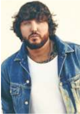
James Arthur verteilt in seinen Songs eine extragroße Portion an Emotionen.

James Arthurs Karriere begann im Jahr 2012. Damals 24 Jahre alt und arbeitslos, tritt er schüchtern vor die Jury der britischen TV-Casting-Show „X-Factor“. Dieser Moment sollte sein Leben für immer verändern! James Arthur setzte sich gegen alle Kontrahenten durch und gewann die Show. Im Finale performte er den Song „Impossible“ von Shontelle. Dieser Song sollte ein Jahr später auch für seinen internationalen Durchbruch sorgen.