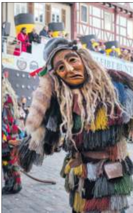
Narren vor der MS Leonberg II. Sie diente auch als Ehrentribüne auf dem Marktplatz.